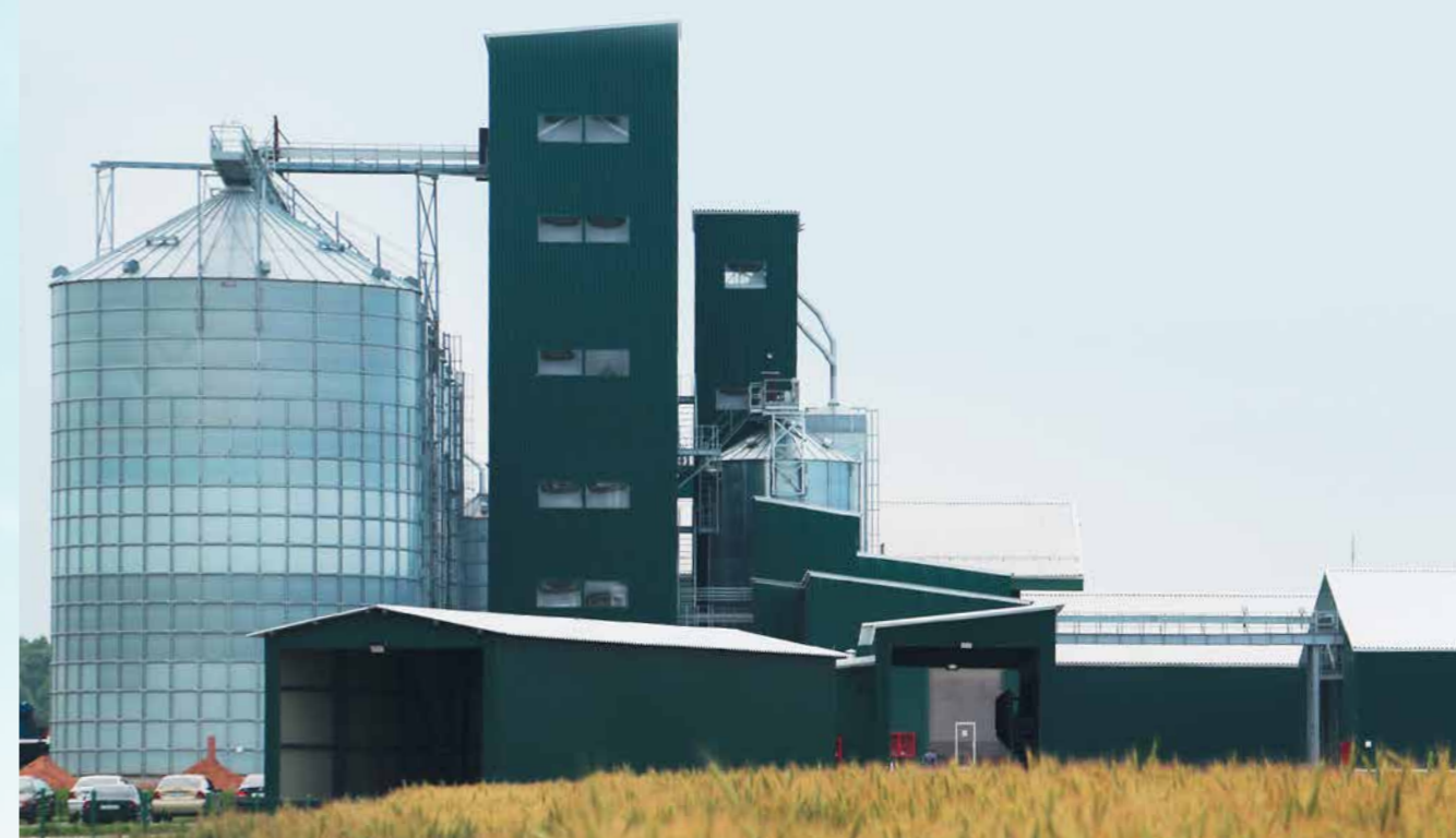
Комбикормовый завод и элеватор в Тверской области

«АгроПромкомплектация» обеспечивает своих животных полезными кормами собственного производства – из сельхозкультур, выращенных на полях в Курской и Тверской областях. Мы постарались наглядно представить весь процесс – от формирования земельного банка до доставки комбикормов на свинокомплексы и молочные комплексы КРС.