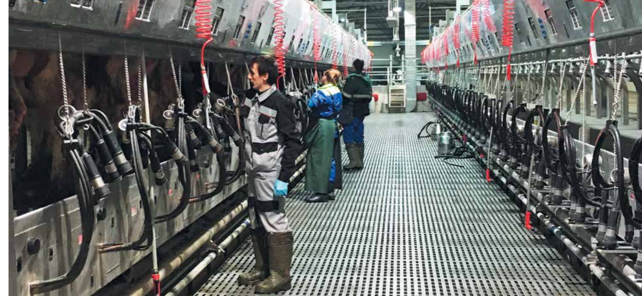
Современный доильный зал высокопроизводительного молочного комплекса «Дмитрогорское молоко» (д. Ручьи)

Повышение себестоимости производства, недостаточный уровень технической и технологической модернизации молокоперерабатывающих предприятий, неблагоприятные экономические условия для реализации продукции не позволяют и дальше наращивать объемы производства. Именно поэтому важную роль в обеспечении продовольственной безопасности играют стабильно работающие и динамично развивающиеся компании, такие как ГК «АгроПромкомплектация». В этом году необходимо повысить доходность производителей и переработчиков молока, увеличивая государственную поддержку и регулируя минимальный уровень закупочных цен на этот продукт. Необходимо стимулировать инвестиционную активность и запустить новые инвестпроекты в молочной отрасли. Это можно сделать, расширив финансирование проектов по льготным ставкам и увеличив объем субсидирования капитальных затрат с 20 до 40%. Комплексное решение этих задач позволит восстановить молочную отрасль, дать ей толчок к развитию, создаст условия для увеличения объемов производства молока и молочных продуктов, снизит количество некачественной молочной продукции на прилавках наших магазинов.