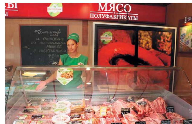
Фирменный магазин «Дмитрогорский продукт»

на прилавках магазинов можно встретить «Дмитрогорский продукт», «Ближние Горки», «Искренне Ваш»