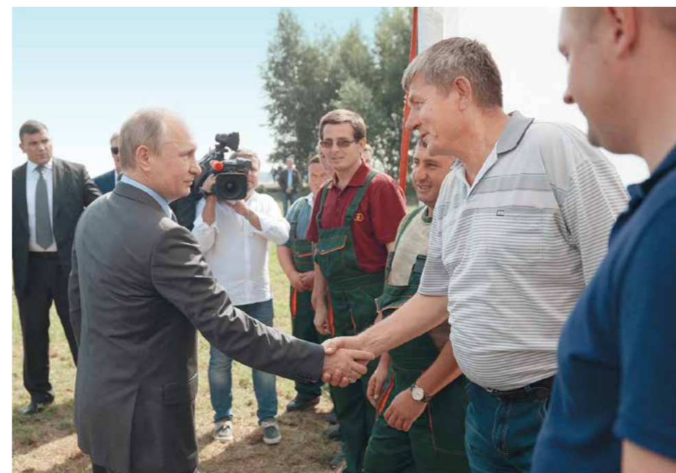
Глава государства Владимир Путин общается с механизаторами ГК «АгроПромкомплектация»

– Комплексный подход к работе «АгроПромкомплектации» олицетворяет собой микромодель российского АПК, но уже новой технологической формации. Как реагируют на столь быстрый рост партнеры и конкуренты?