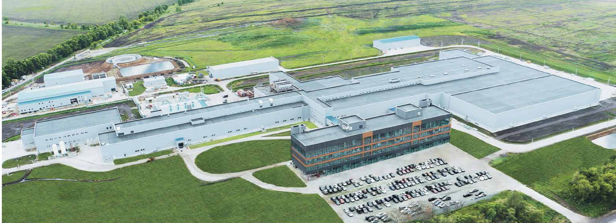
Курский мясоперерабатывающий завод в с. Линец