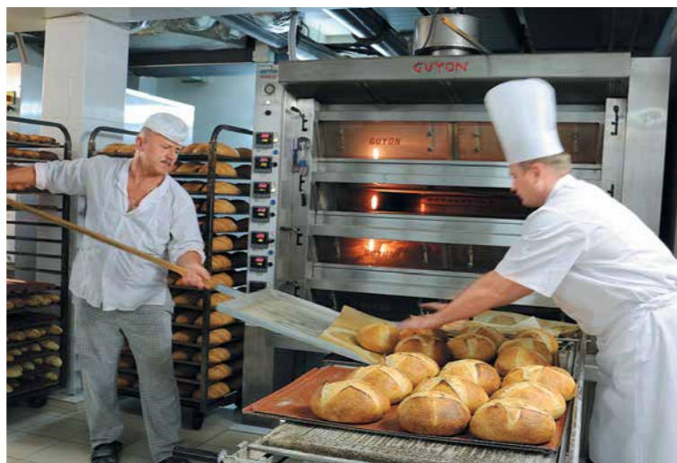
Выпечка хлеба в пекарне «Прованс-Бейкери»