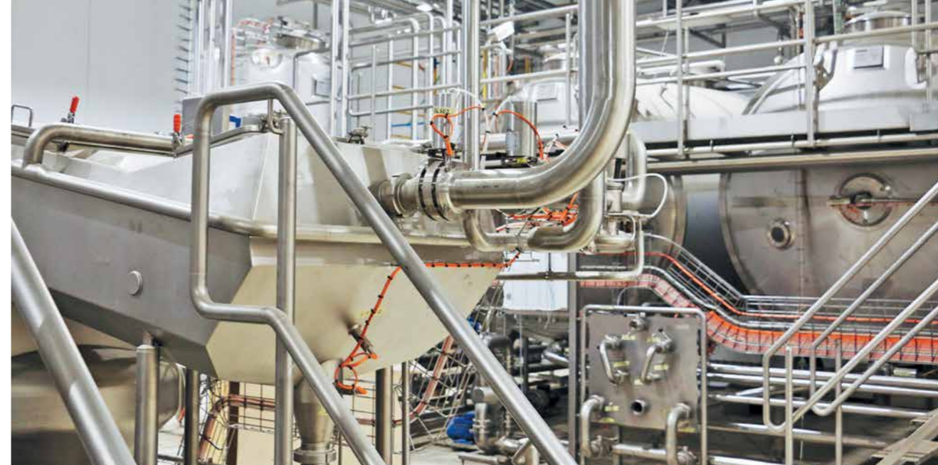
Высокотехнологичное оборудование в цехе по производству творога нового Дмитрогорского молочного завода

Поэтому, когда идет речь о передовых решениях в развитии молочной отрасли, всегда припоминаю колоссальную работу, которую в этом направлении проделали Генеральный директор «АгроПромкомплектации» и его команда. По одному такому предприятию в каждом регионе – и мы молочную отрасль не узнаем!