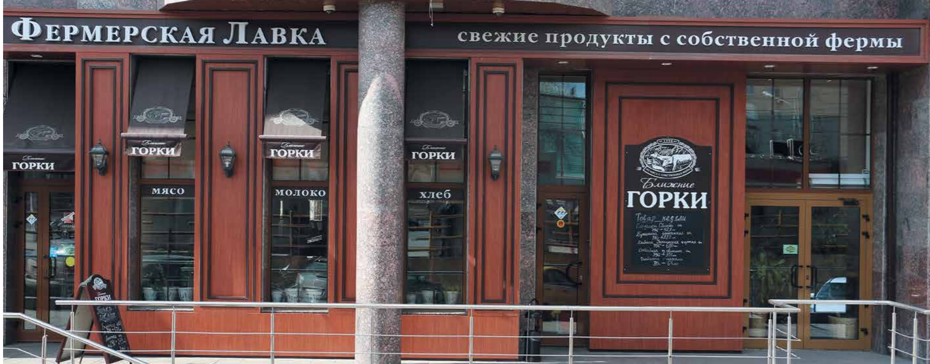
Фермерская Лавка «Ближние Горки» (г. Москва, ул. Б. Каменщики)